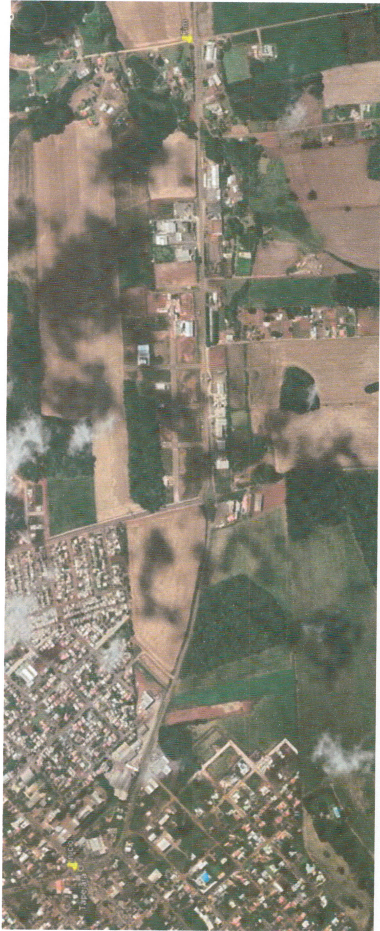
Croqui do Trecho